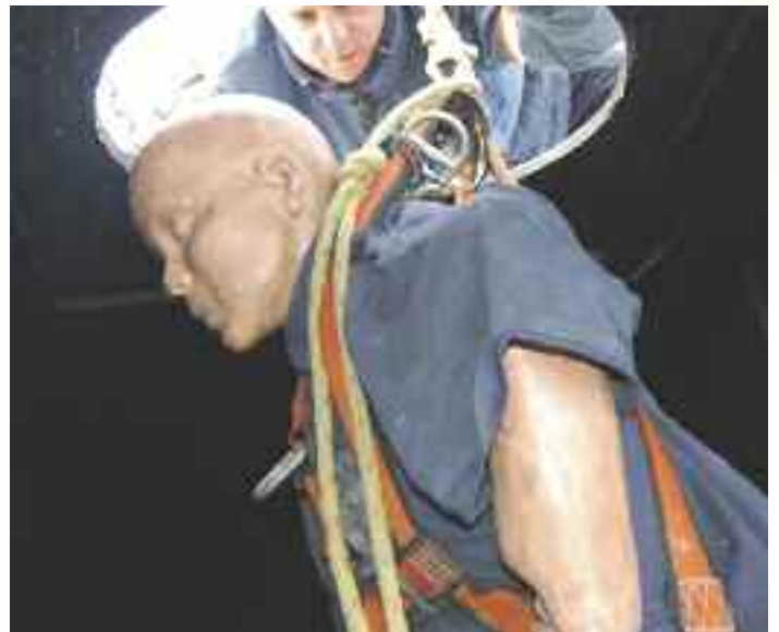
La formation d'une journée et demie consiste à simuler des situations comportant des risques potentiels comme celles auxquelles les participants font face quotidiennement.

Ses responsables considèrent que les producteurs, les membres de leur famille, les employés agricoles de même que tous les travailleurs appelés à intervenir dans un espace clos sur une ferme ont intérêt à suivre une telle formation. Tous doivent prendre conscience des dangers sournois qui les guettent.