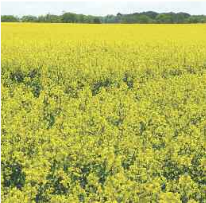
Le canola s'intègre très bien dans la rotation avec les céréales, dont le maïs, et les plantes fourragères.

Par les temps qui courent, on entend beaucoup parler de canola. En effet, l'usine de trituration de Bécancour, TRT ETGO, sera un très gros acheteur de grains de soya et de canola avec son million de tonnes de grains consommés annuellement. Cette nouvelle opportunité de marché permet le questionnement, le canola est-il adapté à ma ferme?